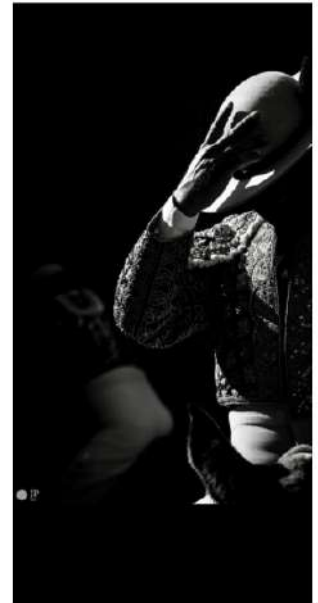
PICADOR, OBRA DE JUAN PELEGRÍN

Las fuerzas del ataque eran aprovechadas por el buen picador para conducir la acción del burel con la resistencia del jaco y la fuerza de su brazo, más la del apoyo en el citado pie izquierdo inserto en el estribo, que fijaba más corto para poder equilibrar mejor el cuerpo en el esfuerzo.