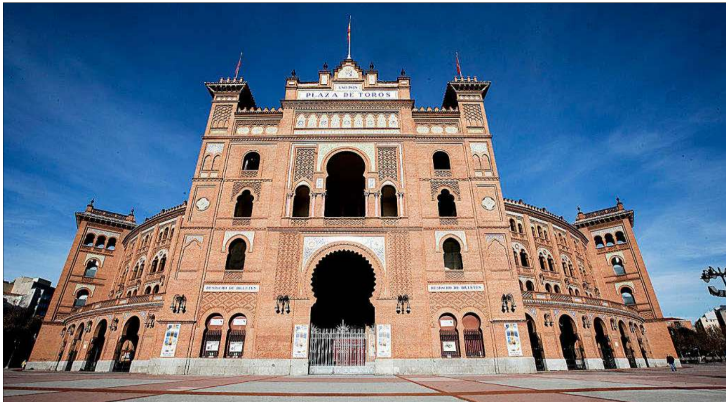
La Monumental de las Ventas sale otra vez a concurso público, que tendrá como fecha tope la segunda mitad del primer trimestre de 2022.

CONCURSO EN 2022 HOY SE PRESENTA EL PLIEGO