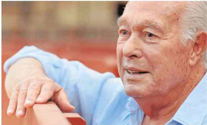
El mítico torero sevillano Curro Romero, protagonista de esta serie en Canal Sur Televisión.