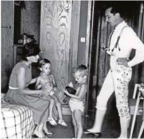
El torero Luis Miguel Dominguín y su mujer junto a sus hijos Miguel y Lucía en su casa de Pollensa (Mallorca) antes de una corrida en agosto de 1959

dicina de la época, que le hubiera salvado de enfermar como sucedió. Ni siquiera la presión de los amigos que les acompañaban en la aventura consiguió hacer entrar en razón al torero. Todos estaban preocupados al ver que el paludismo hacía mella en el pequeño Miguel a medida que pasaban los días. Pero para Dominguín «la quinina es una mariconada que no sirve para nada», ponía como excusa para no dársela. Según él, su hijo no tenía malaria sino mamicitis. Bosé no protestó jamás, para no decepcionar a su padre aunque la aventura en la selva le dejó claro que nunca estaría a la altura de sus expectativas y decidió no esforzarse nunca más. También Dominguín llegó un momento en el que se arrepintió de habérselo llevado. Era un estorbo y se lo hacía pagar a diario.