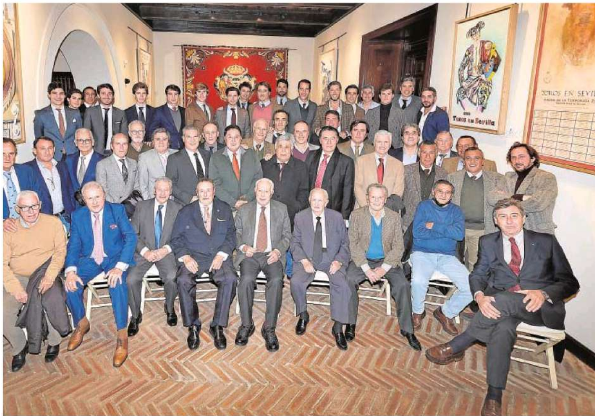
Sevilla acompañando a Curro Romero en el Salón de Carteles de la Real Maestranza de Caballería

ros capítulos de la serie 'Curro Romero, el Faraón'. Un serial compuesto por cinco entregas que surge como extensión para plataformas audiovisuales del documental 'Curro Romero, maestro del Tiempo'.