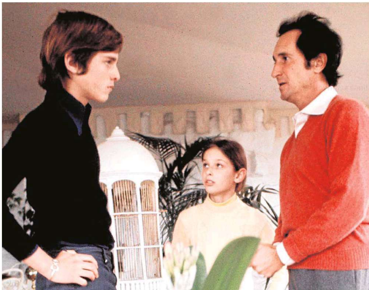
A la izda, un adolescente Miguel Bosé discute con su padre en presencia de su hermana Lucía