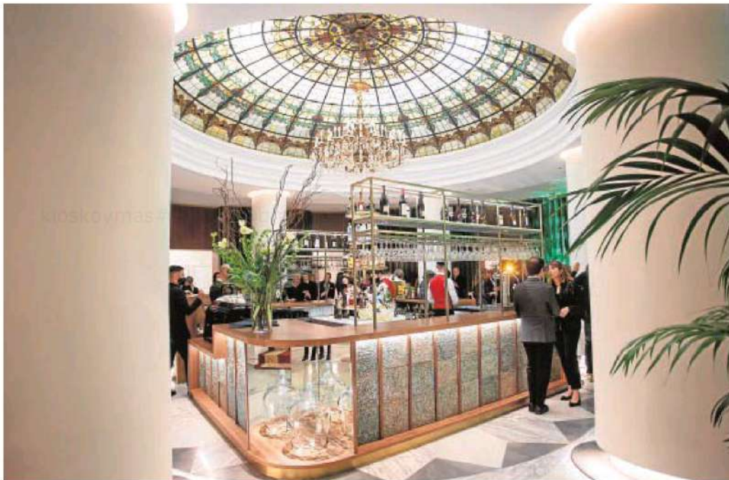
Bajo la cúpula original, hecha con miles de cristales diferentes, se ubica el nuevo 'Bar Colón'