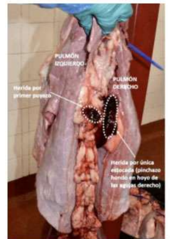
HERIDA EN EL MEDIASTINO A UN «JUANPEDRO» LIDIADO EN ZARAGOZA EL 10/X/2019.