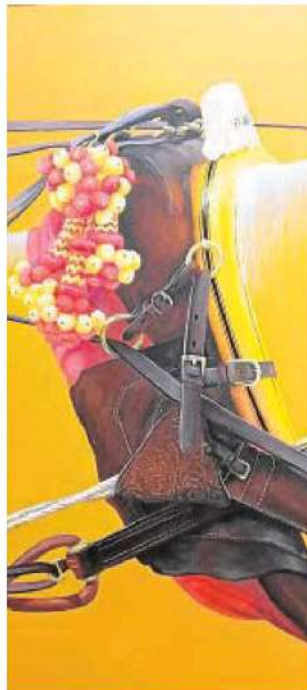
Detalle del cartel de Alcántara // ABC

El cartel debe realizarse bien sobre lienzo o tabla, montada en ambos casos sobre bastidor. Los participantes podrán escoger la técnica pictórica que prefieran (óleo, acrílica, mixta, etc.), pero no se admitirán las obras retocadas o realizadas mediante medios digitales o reproducción fotográ-