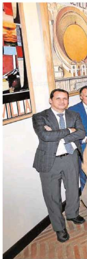
Foto de familia de los toreros de

Y la corporación nobiliaria, que ofreció sus dependencias y logística para el homenaje, también estuvo representada por su teniente de Hermano