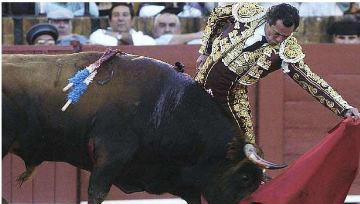
Manzanares at La Maestranza in Sevilla.

(You can find a recording of the song at www.youtube.com/watch?v=zCX39bbmq-g .)