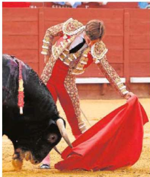
El Juli cortó una oreja al cuarto toro de la tarde

Está doblando el primer toro (bis) de la tarde. De fondo suena una leve ovación para El Juli. Siendo riguroso con la verdad, había sido una correcta labor. De las que no pasarán a la historia, pero tampoco recibirán las críticas del respetable. Un toro menos en el contador. Mientras lo estoy anotando en la reseña me interrumpe un vecino de localidad y me dice algo que me desconcierta. Una sentencia tan simple como certera. De esas que te descolocan. Aquel