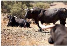
Los Miura tienen personalidad propia.

Y destacan la personalidad de Don Juan Carlos. "Muy sencillo. Incluso se hizo fotos con los empleados del cortijo. Tiene derecha, izquierda y centro. Para eso es un fenómeno".