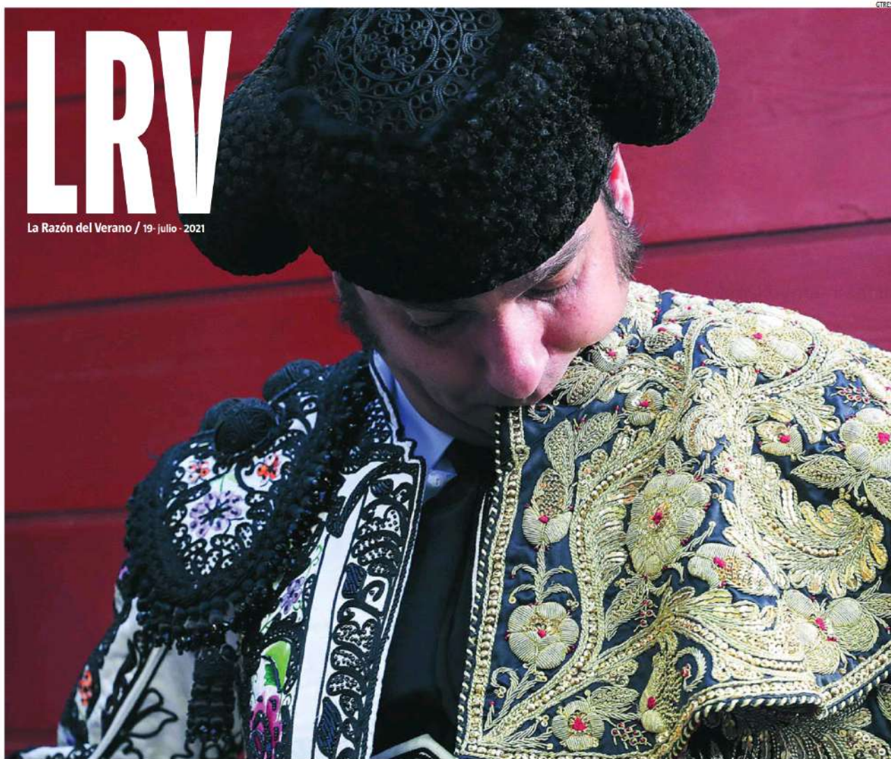
Una imagen del diestro sevillano tomada en Illescas en 2019