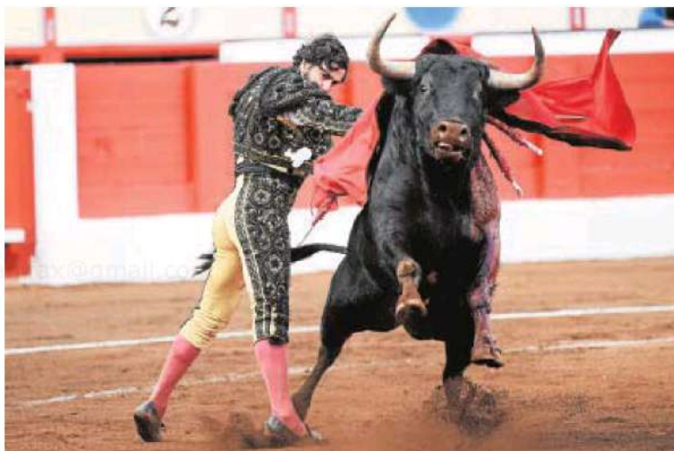
Morante de la Puebla ofreció una tarde para el recuerdo // SERRANO ARCE

Roca Rey volvía por tierras gaditanas tras su triunfo algecireño del pasado fin de semana. Tuvo en primer turno el toro de mayor alegría y emoción de la corrida, al que no entendió a la verónica —lo espera en exceso y a su encuentro le cambia el viaje— y que tensionó demasiado con la muleta. El compás muy abierto y el trazo tan largo que le resultaba imposible al animal. El toro se asfixió y la faena mermó. Directamente nunca tomó vuelo. Lo esencial escaseó y lo accesorio faltó en esta ocasión. Con el sexto, un animal que acusó las luces de los focos y pecó de raza. Aquí apareció lo accesorio: unas bernadinas sin ayuda que calentó al personal. Lo más reseñable.